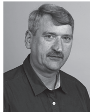
FRIEDE SCHOONE BOSTIK GMBH