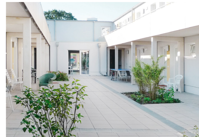
Einzelwohnungen wurden um den Innenhof gegliedert.

schutzes kostengünstig realisieren. Die Dicke der Dämmschicht wird dazu flexibel dem geforderten Wärmedämmniveau angepasst.