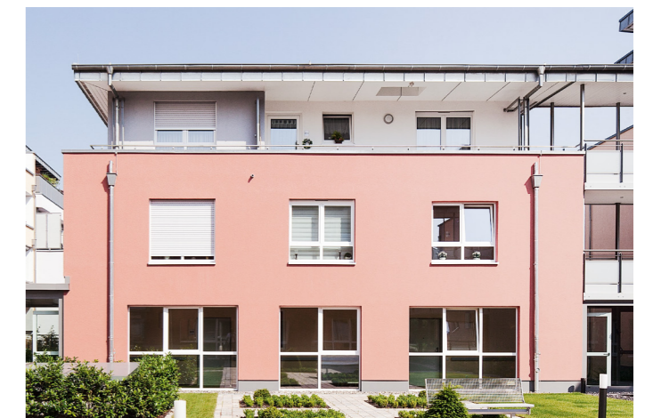
Ein klares Farbkonzept der WDVS-Fassaden strukturiert die facettenreiche Gestaltung der Wohnanlage.

Im Vergleich zu anderen Baumaterialien wird durch den Einsatz hochbelastbarer Kalksandsteine ein deutlicher Flächengewinn von bis zu sieben Prozent erzielt. Aufgrund der hohen Tragfähigkeit sind mit Kalksandstein schlanke Wandkonstruktionen möglich. Außenwände lassen sich bereits mit einer Dicke von 150 mm ausführen. Innenwände erfüllen die hohen statischen Anforderungen ab einer Dicke von nur 115 mm. Kalksandsteinwände sparen