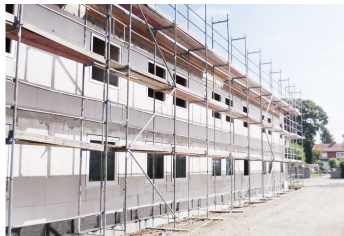
Verkürzung von Bauzeiten durch schnell wachsende Kalksandsteinwände.

Ein wesentlicher Schritt und eine notwendige Grundlage zum kostensparenden Bauen ist für Siebrecht die Bildung von Bauteams in einem möglichst sehr frühen Planungsstadium. „Für uns